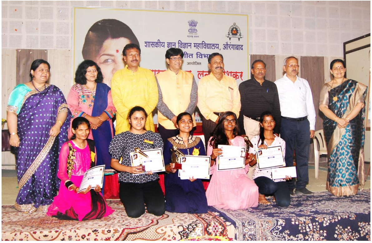
BHARAT RATNA LATA MANGESHKAR STATE LEVEL SINGING COMPETITION