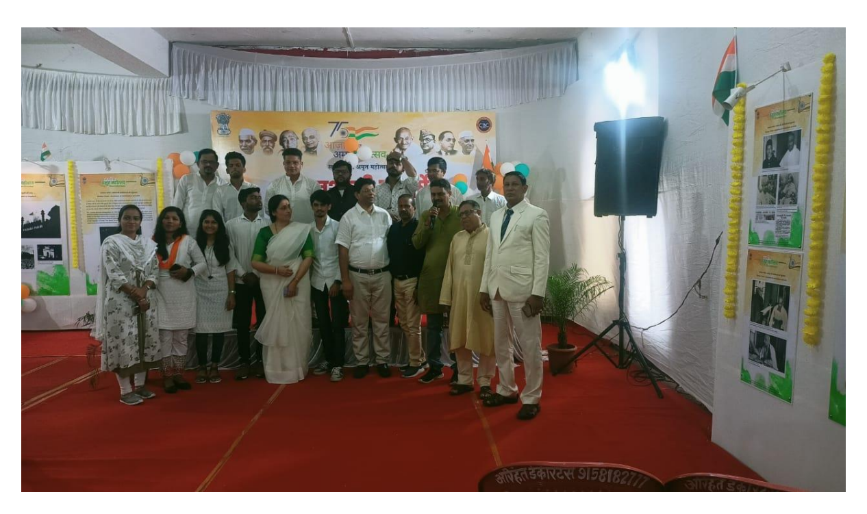
BHARAT RATNA LATA MANGESHKAR STATE LEVEL SINGING COMPETITION