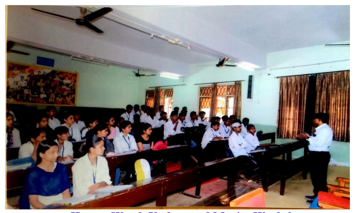
How to Watch Understand Movies Workshop