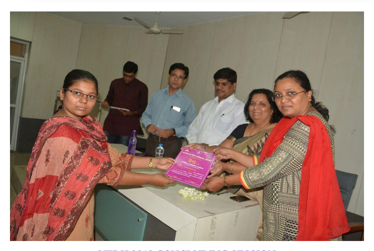
VEDH 2018 CONCLUDING SESSION