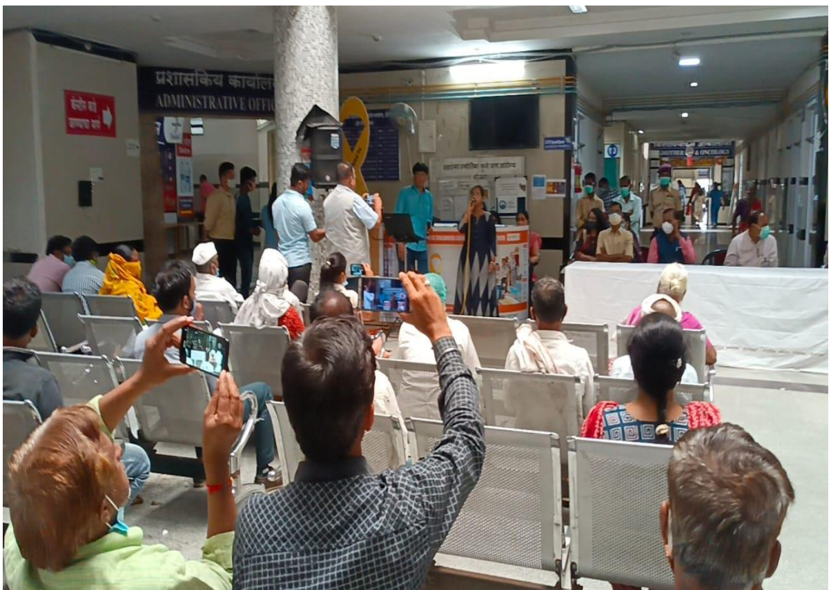
STUDENTS FROM MUSIC DEPARTMENT PERFORMING AT CANCER HOSPITAL