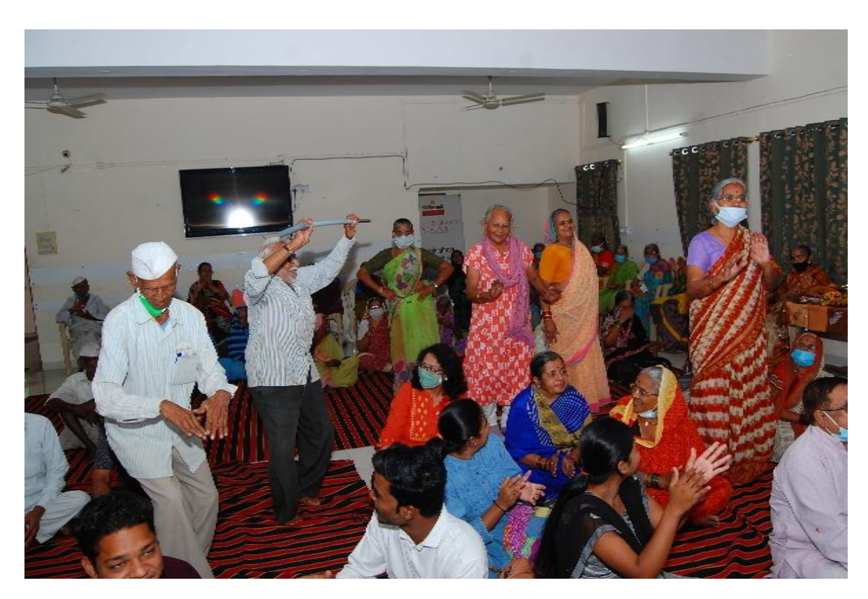
MELODIOUS SONGS IN MEMORIES